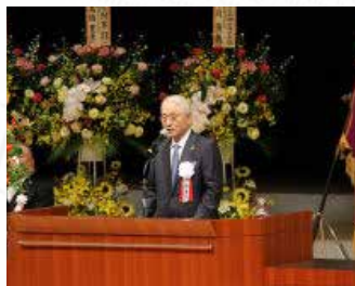
《記念式典・祝賀会》